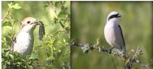
Pie grièche écorcheur femelle et mâle

La Pie-grièche écorcheur est une espèce typique des milieux semi-ouverts. Les mots-clés qui résument ses besoins